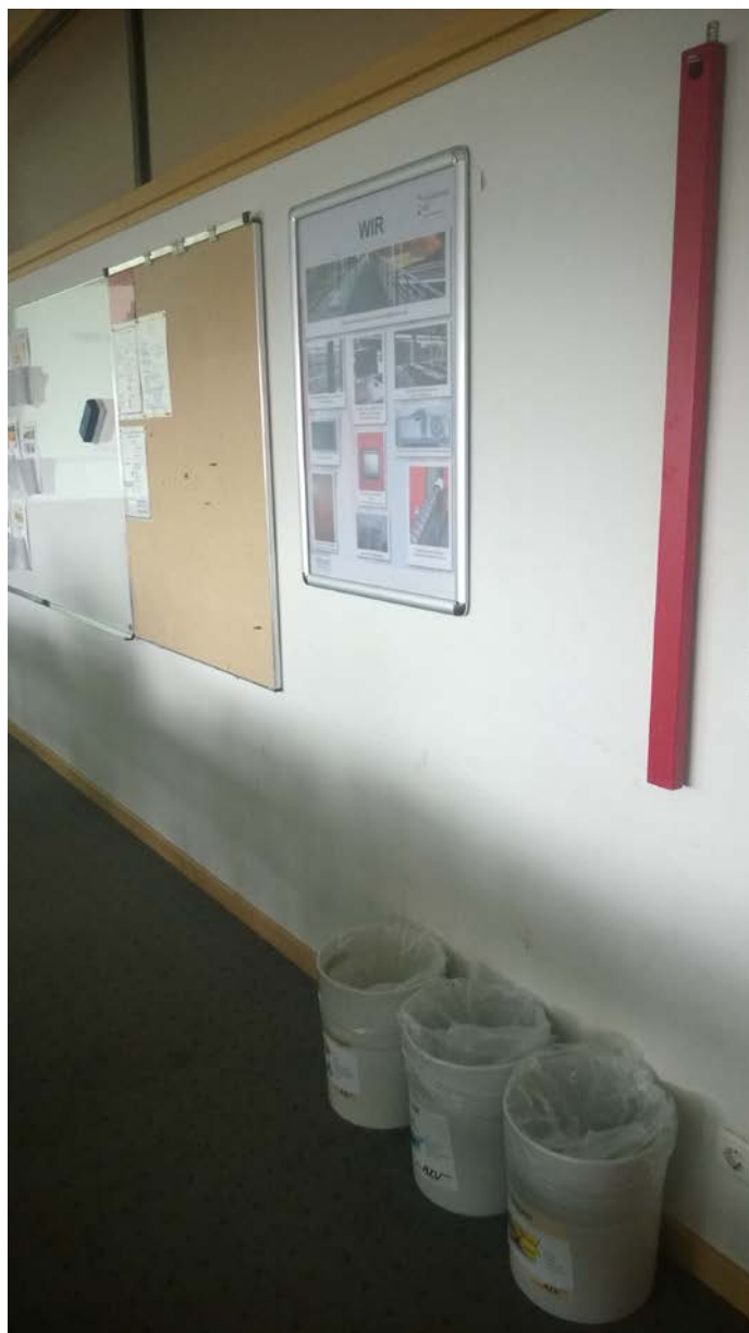
На фото аудитория университета города Хоф (Бавария, Германия).

объяснят, они понимают важность этого дела. Ведь этот огрызок (биоотход) впоследствии сможет превратиться в биогаз, энергию или даже компост для растений, а это развитие целой страны: промышленности и экономики. В настоящее время мир испытывает недостаток ресурсов, а так все выигрывают.